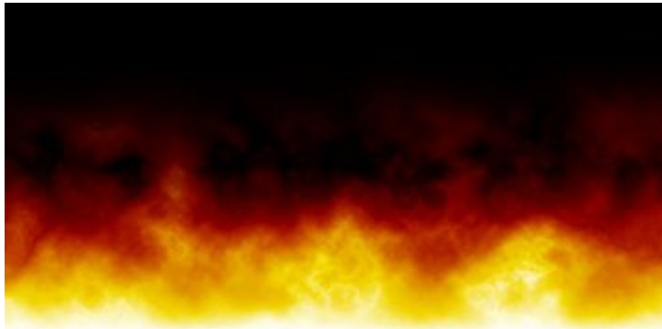
Figure 1 – Feu généré à partir du bruit de Perlin